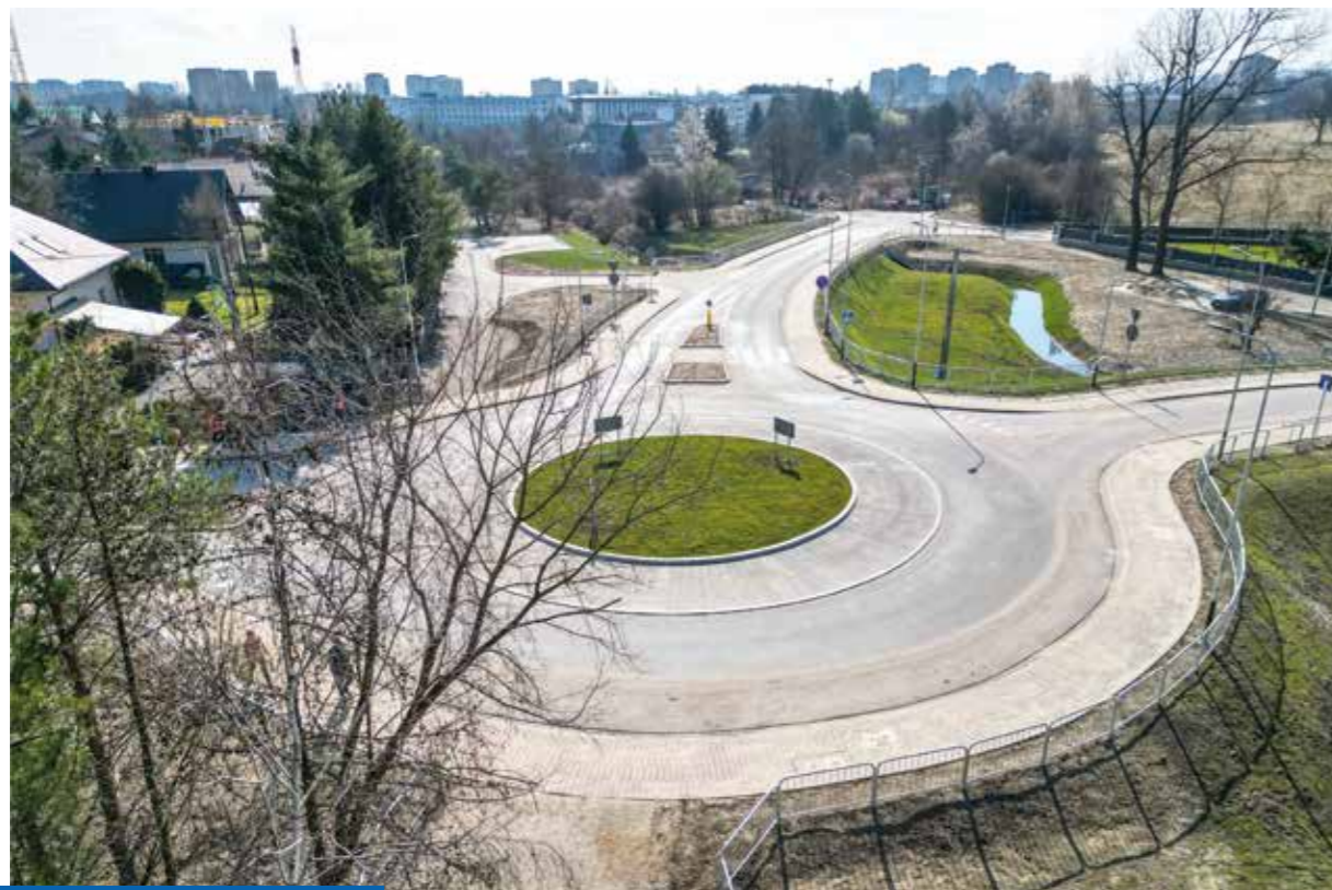
Rondo Jordanowska / Stelmachów

Inwestycja dofinansowana jest z Rządowego Funduszu Rozwoju Dróg w ramach projektu: "Przebudowa drogi w ciągu ulic: Piaskowej, Stelmachów i Jordanowskiej oraz remont ul. Marii Konopnickiej na odcinku mostu Dębnickiego w Krakowie".