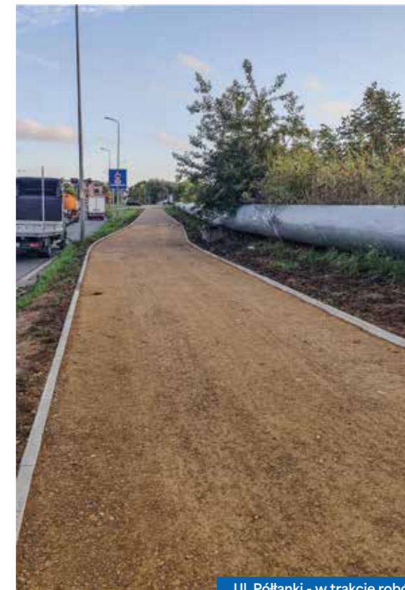
Ul. Półtanki - w trakcie robót

Kilka dróg dla rowerów przeszło miejscowe naprawy, m.in.: fragment drogi dla rowerów przy ul. Reymonta – na wysokości Uniwersytetu Rolniczego i AGH do Alei Trzech Wieszczów; fragment drogi dla rowerów przy ul. Armii Krajowej w okolicach skrzyżowania z ul. Zarzecze; fragment drogi dla rowerów wzdłuż al. Solidarności na odcinku między ul. Bulwarową a kombinatem.