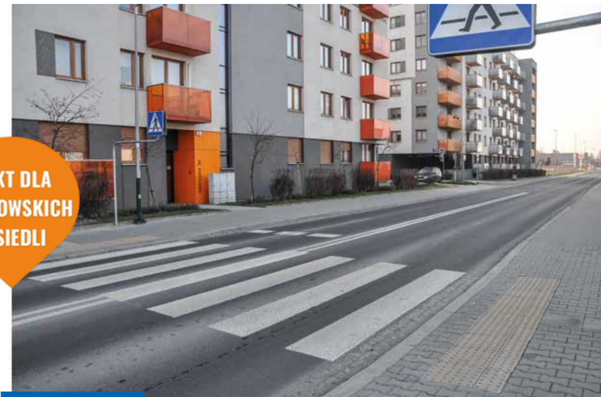
Przejście na ul. Galicyjskiej