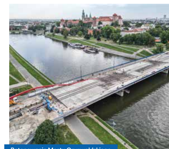
Betonowanie Mostu Grunwaldzkiego

Wszystkie prace na moście zakończą się w 2026 r. Dzięki nim przeprawa będzie mogła służyć krakowianom i przyjezdnym przez kolejne kilkanaście jak nie kilkadziesiąt lat. W tym czasie miasto będzie musiało się przygotować do budowy zupełnie nowej przeprawy.