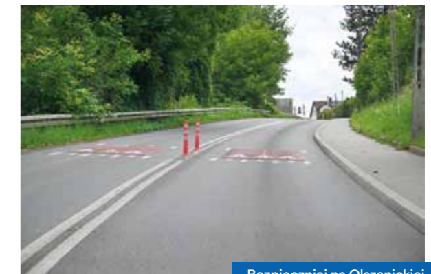
Bezpieczniej na Olszanickiej

Zadanie jest kontynuowane przez Zarząd Inwestycji Miejskich (ZIS) oraz Zarząd Zieleni Miejskiej (ZZM).