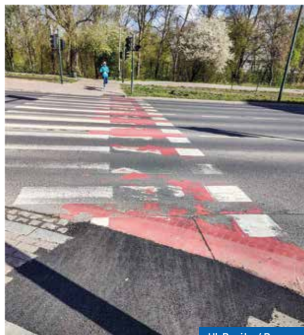
Ul. Brożka / Borsucza

Gruntowa droga ul. Krzyżówka, wykorzystywana przez rowerzystów do przejazdów między Laskiem Wolskim a Balicami czy Zabierzowem przekształciła się w ulicę utwardzoną. Pracami objęte były odcinki: od ul. Podkamyk do ul. Powstania Styczniowego oraz od ul. Powstania Styczniowego (przejazd kolejowy) do autostrady.