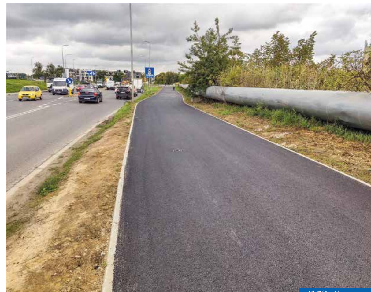
Ul. Półtanki - po pracach