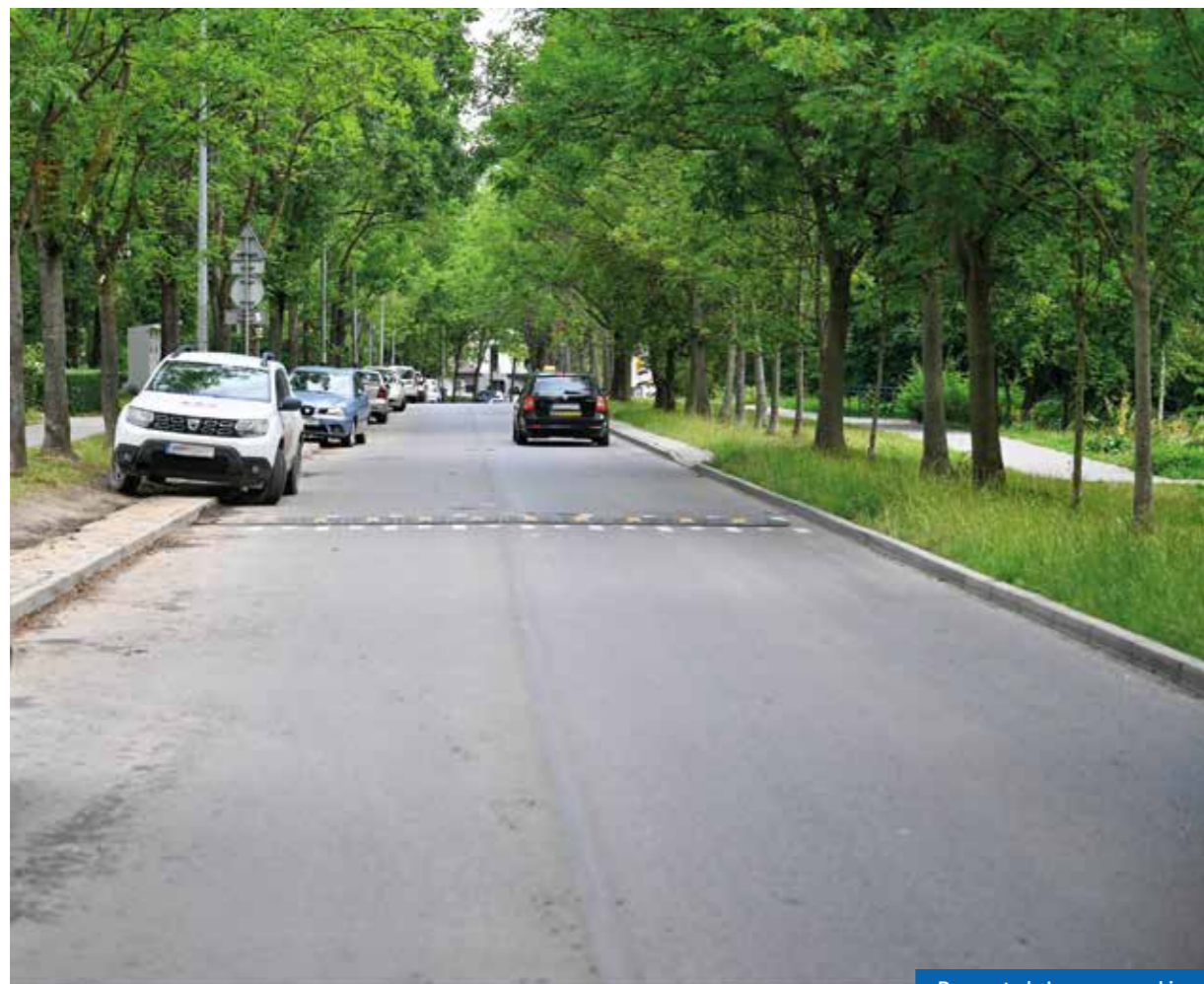
Remont ul. Jerzmanowskiego