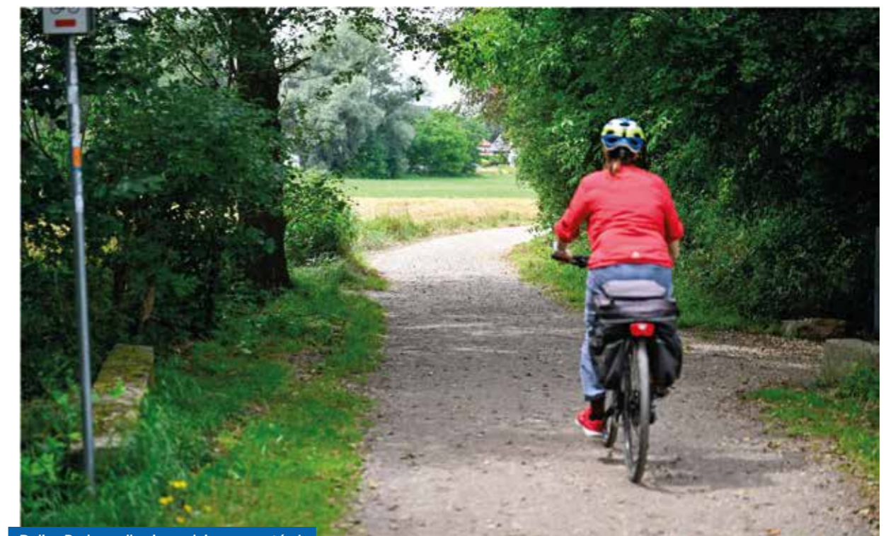
Dolina Rudawy dla pieszych i rowerzystów!