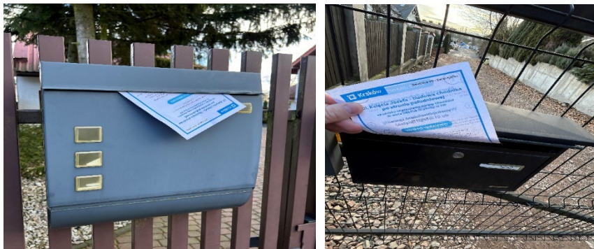
Zdjęcia z dystrybucji ulotek