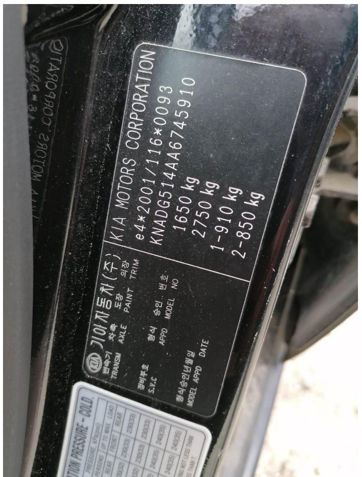
WhatsApp Image 2024-07-29 at 12