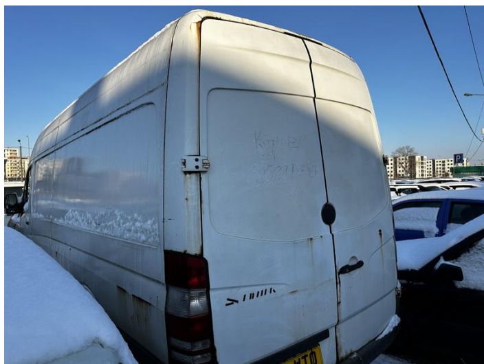
IMG_5789 — kopia