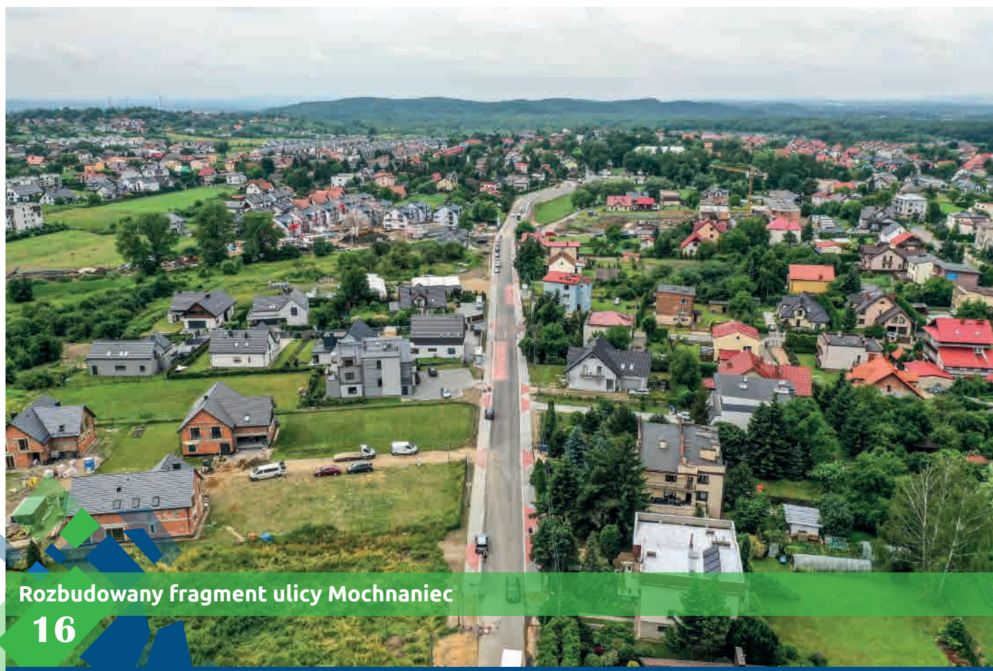
Rozbudowany fragment ulicy Mochnaniec

Łączna kwota wydana na realizację zadania