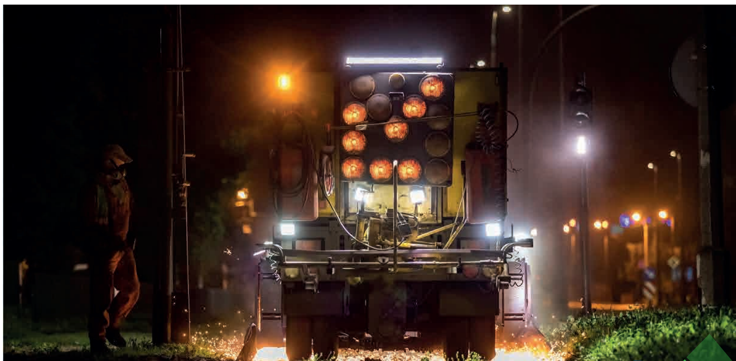
Nocne szlifowanie torowiska tramwajowego - ulica Bronowicka