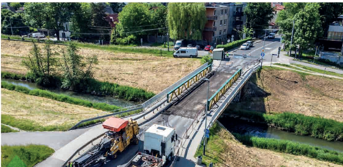
Remont mostu nad rzeką Rudawą w ciągu ulicy Piastowskiej