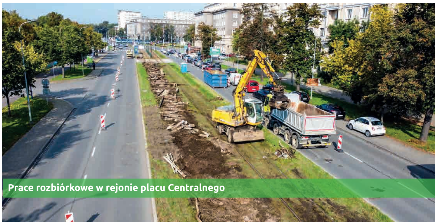
Prace rozbiórkowe w rejonie placu Centralnego

Ekipy zakończyły już prace rozbiórkowe i korytowanie. Na kilku odcinkach wykonywane jest wzmocnienie podłoża materacami kamiennymi oraz warstw podbudowy torowiska, na której zostaną ułożone różne konstrukcje torowe. Na niektórych fragmentach torowisko będzie „zielone”, na innych klasyczne lub na płytach torowych (na przejazdach, przejściach dla pieszych, przy peronach tramwajowych). Infrastruktura przygotowywana jest pod słupy trakcyjne. Trwają prace przy oświetleniu ulicznym oraz sygnalizacji świetlnej. Obecnie wykonawca pracuje również na skrzyżowaniu al. Jana Pawła II z ul. Zachemskiego i Zuchów. Roboty potrwać tu do połowy lutego 2022 r. Po tym czasie ruszą prace na kolejnym skrzyżowaniu, z ul. Daniłowskiego, a następnie z ul. Bulwarową i Klasztorną. Cała inwestycja zgodnie z umową powinna zakończyć się w lipcu 2022 r., a jej koszt to ok. 33 mln zł.