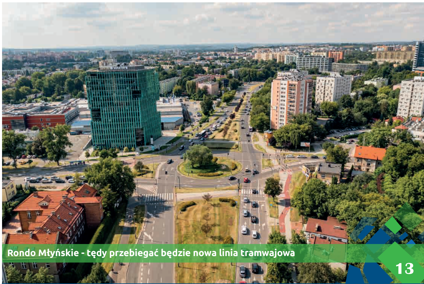
Rondo Młyńskie - tędy przebiegać będzie nowa linia tramwajowa

Łączna długość odcinka nowej linii tramwajowej przebiegająca pod poziomem terenu