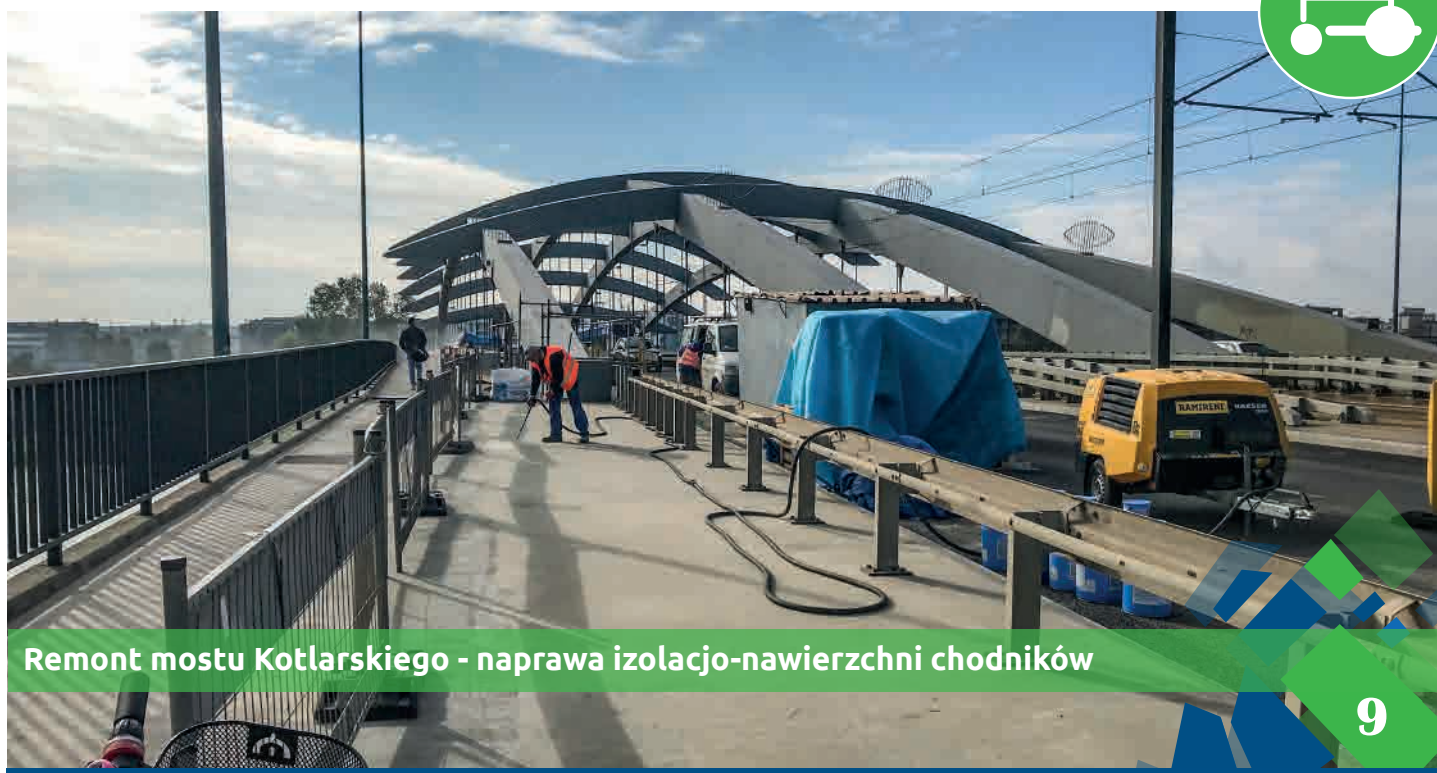
Remont mostu Kotlarskiego - naprawa izolacji-nawierzchni chodników