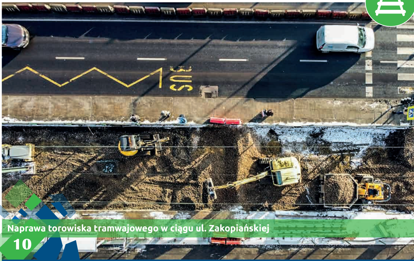
Naprawa torowiska tramwajowego w ciągu ul. Zakopiańskiej

Z końcem roku ruszyła naprawa torowiska wzdłuż Zakopiańskiej - wymiana torowiska na odcinkach od węzła Łagiewniki do Trasy Łagiewnickiej oraz od Trasy Łagiewnickiej do centrum Solvay - w sumie ok. 2,5 km pojedynczego toru. Dodatkowo na samej pętli Borek Fałęcki wymiana zwrotnic (6), sieci trakcyjnej, sterowania i ogrzewania zwrotnic oraz napawanie. Prace pochłoną 14 mln zł i zakończą się w marcu 2022 r.