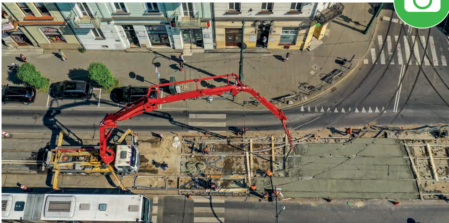
Naprawa torowiska tramwajowego na węźle Lubicz-Rakowicka