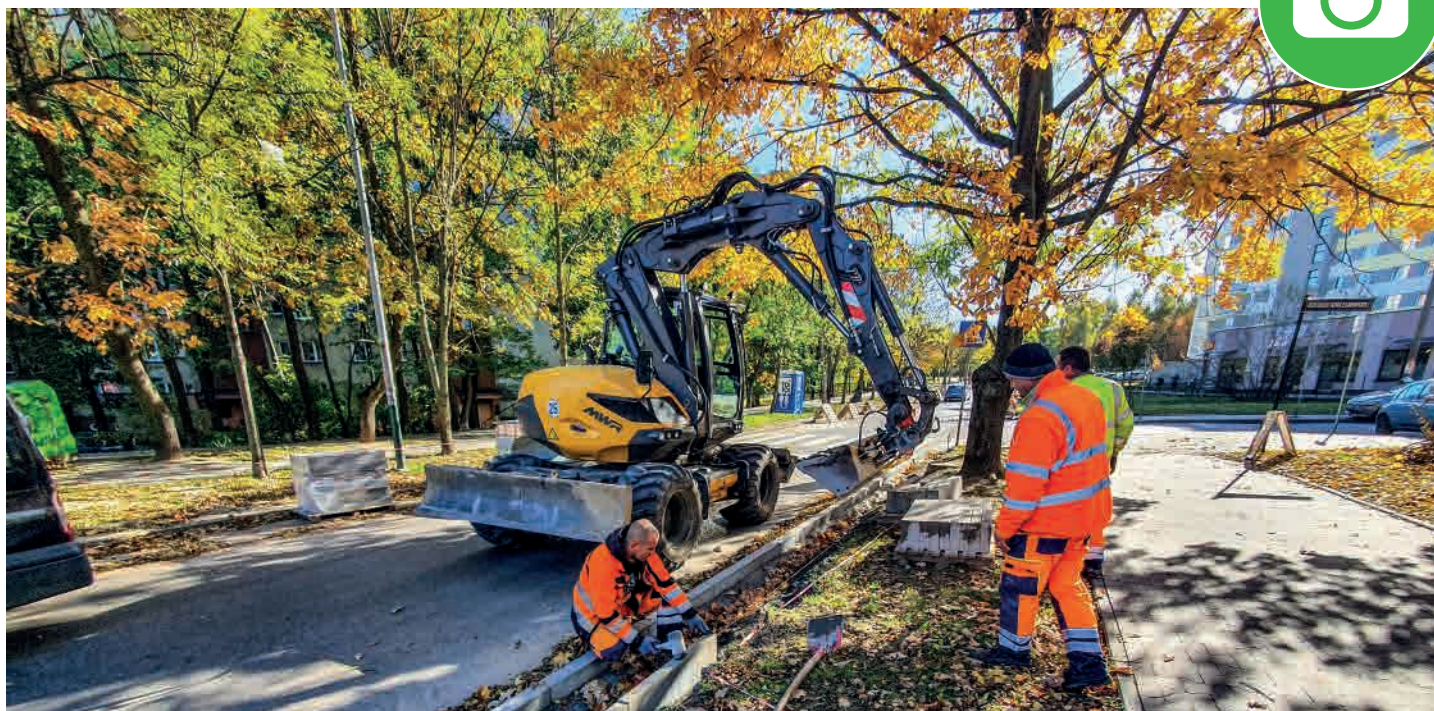
Remont jezdni i chodnika na ulicy Konrada Wallenroda na odcinku od Teligi do Ściegiennego