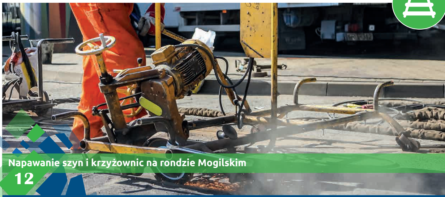
Napawanie szyn i krzyżownic na rondzie Mogilskim