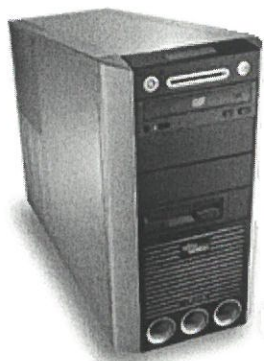
Component PC Celsius Floorstand